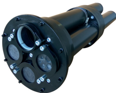
Bild 1: Mehrsparten-Hauseinführung für Gebäude mit Keller Typ MSHE-T

Die 4 pipes GmbH verfügt über Kernkompetenzen im Bereich Korrosionsschutz und mechanischer Rohrschutz und ist Problemlöser und Komplettanbieter für viele Anforderungen und Anwendungen im Rohrleitungsbau. Die Produktpalette umfasst u. a. Dich-