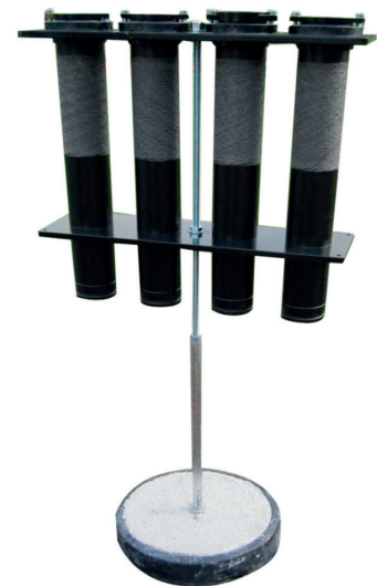
Bild 2: Mehrsparten-Hauseinführung für Gebäude ohne Keller Typ MSHE-NR

Die neuesten Produkte der 4 pipes GmbH sind die Mehrsparten-Hauseinführungen für Gebäude mit und ohne Keller. Diese bieten eine kompakte und sichere Komplettlösung zur Bauwerkseinführung der unterschiedlichen Gewerke (Gas, Wasser, Elektro und Telekommunikation) in einer gemeinsamen